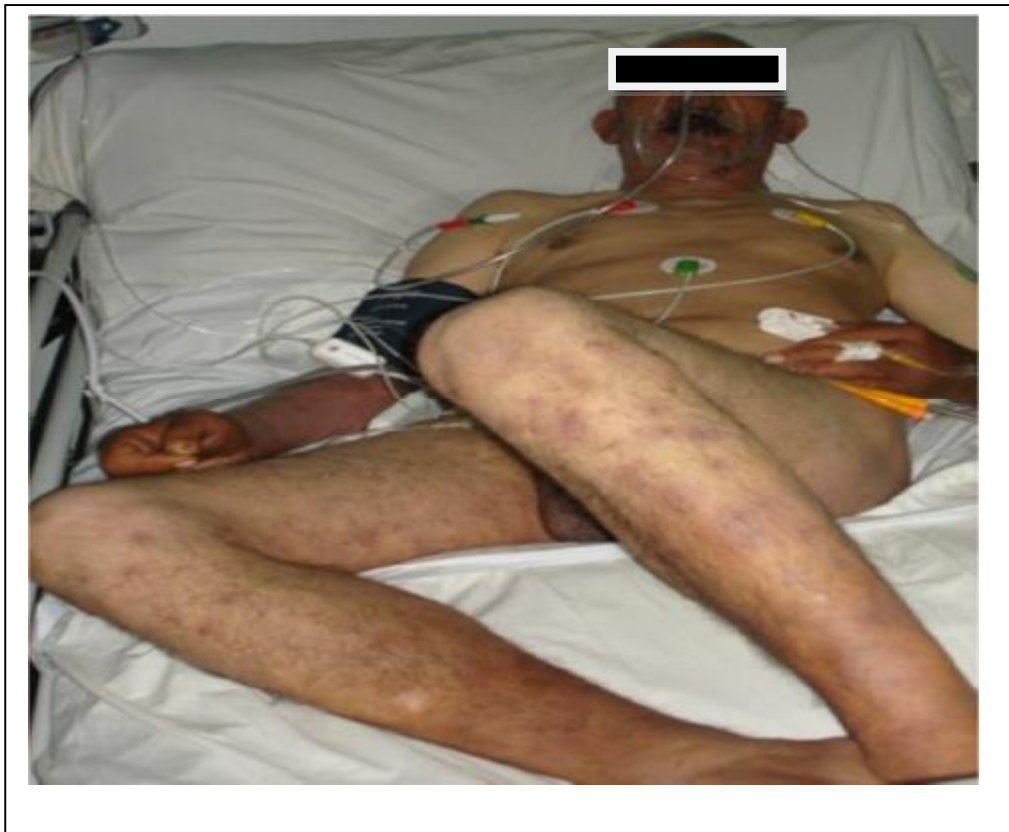
Figure N°10 : Le patient à l'admission avant l'intubation.