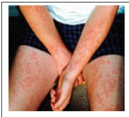
Figure 3: Urticaire

Les manifestations cutanées sont absentes en cas d'état de choc d'emblée.