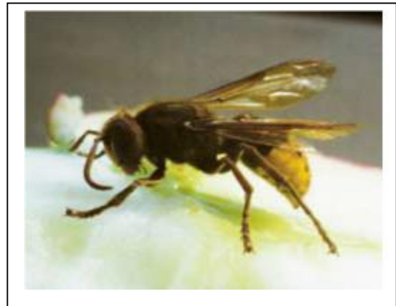
Figure 7: le frelon

Les frelons sont moins agressifs que les guêpes ; le risque de piqûre existe surtout à proximité d'un nid.