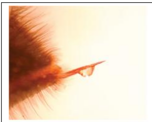
Figure 1: Appareil piqueur

Après la piqûre, l'abeille ouvrière ne peut pas retirer son aiguillon elle va mourir plus tard car une partie de son abdomen a été arraché. La reine quant à elle, ne meurt pas car elle possède un aiguillon lisse qui peut être retiré facilement après la piqûre (5).