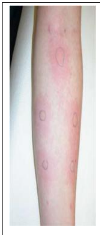
Figure 8: Le test cutané (Spital Nertz Bern Ziegler, Berne)

Malheureusement ces tests ne servent pas de tests de dépistage et ne sont pas recommandés à ceux qui n'ont pas d'histoire de réactions allergiques systémiques à une piqûre. En fait, la moitié des réactions mortelles surviennent chez des patients sans antécédent de réaction (31).