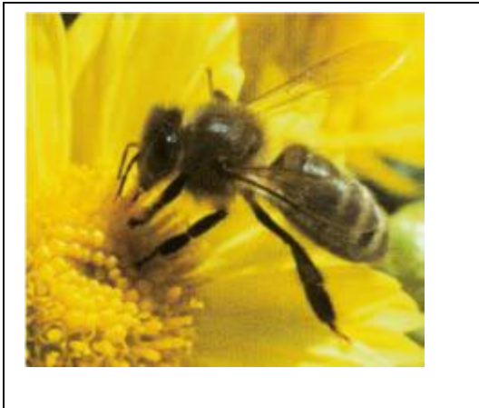
Figure 4: L'abeille.

Survivant l'hiver, l'abeille peut donc piquer même lors de jours hivernaux, chauds et ensoleillés. Après la piqûre, le dard de l'abeille reste dans la peau.