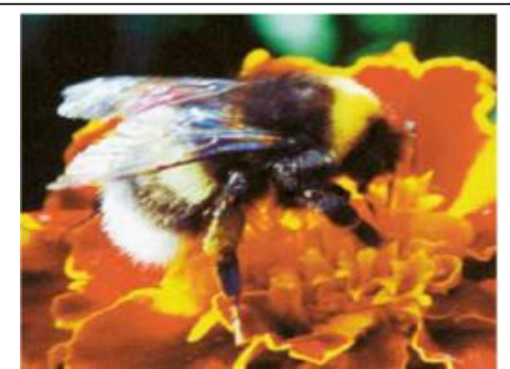
Figure 6: le bourdon

Les piqûres de bourdon sont rares : elles ont lieu surtout lors de travaux de jardinage, dans les serres ou des plantes sont fécondées par des bourdons.