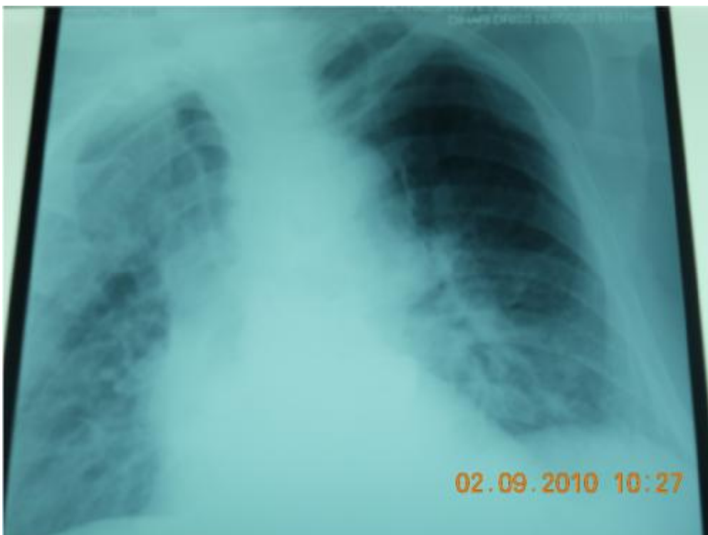
Figure N°9 : Radiographies thoraciques montrant un œdème pulmonaire.