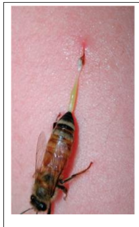
Figure 2: Sac à venin